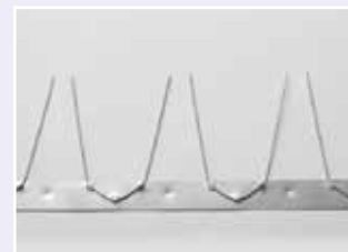
Nr. 71 E 002050 Nr. 71 E 002100