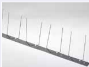
Nr. 71 E 003