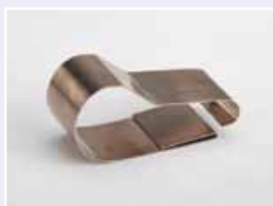
Nr. 71 E 004