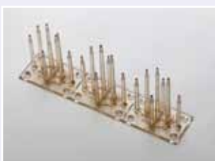
Nr. 71 K 100