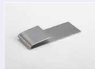
Nr. 71 E 005